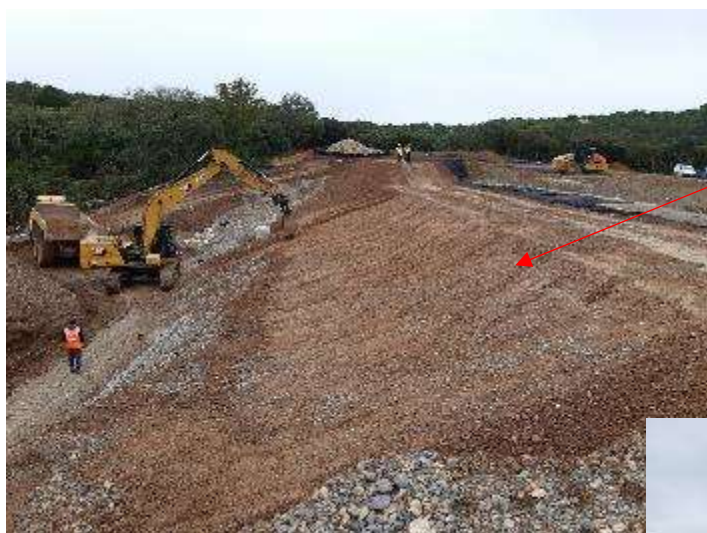
Remblai amont du barrage